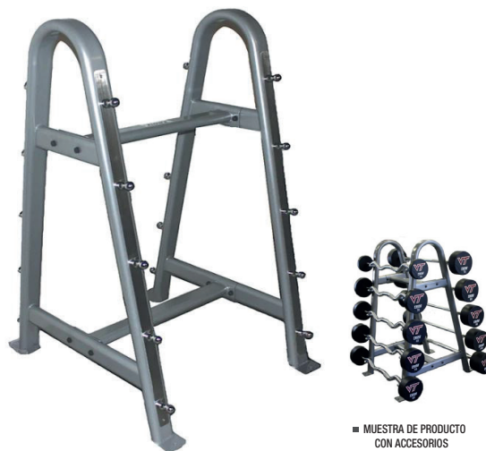
■ MUESTRA DE PRODUCTO CON ACCESORIOS