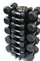
■ MUESTRA DE PRODUCTO CON ACCESORIOS