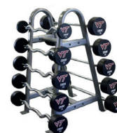
■ MUESTRA DE PRODUCTO CON ACCESORIOS