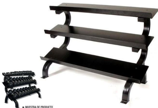
■ MUESTRA DE PRODUCTO CON ACCESORIOS

Rack horizontal de 3 niveles, admite una serie de 5 a 75 mancuernas sólidas (15 pares) estructura resistente de calibre 11 de fácil acceso.