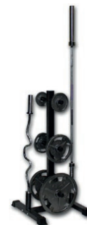
■ MUESTRA DE PRODUCTO CON ACCESORIOS