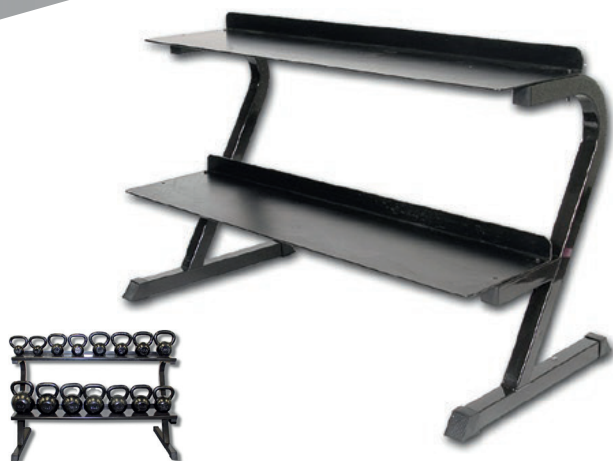
■ MUESTRA DE PRODUCTO CON ACCESORIOS