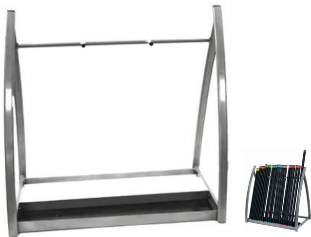
■ MUESTRA DE PRODUCTO CON ACCESORIOS

Rack para barras troy diseñado para almacenar hasta 24 barras. ideal para ahorrar espacio y mantener el gimnasio en orden.